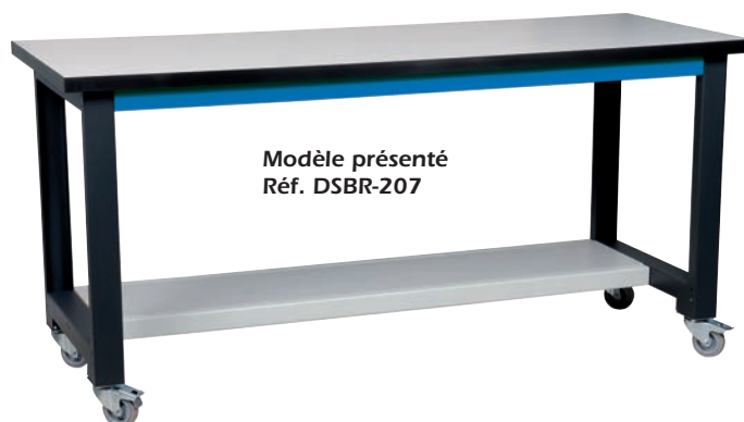
Modèle présenté Réf. DSBR-207