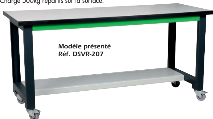
Modèle présenté Réf. DSVR-207