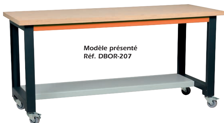
Modèle présenté Réf. DBOR-207